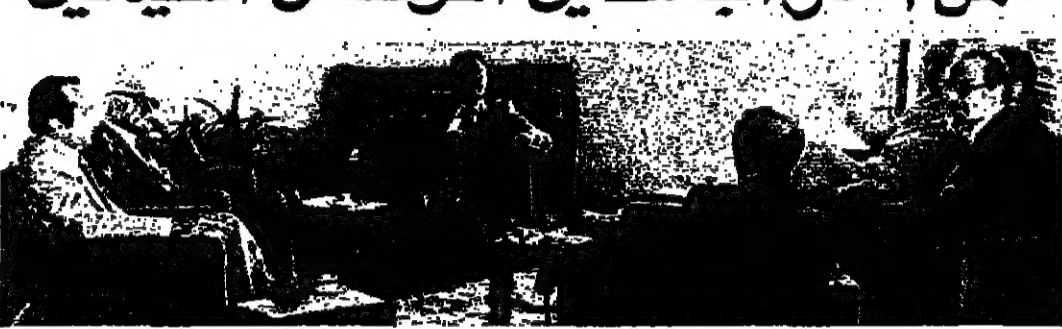
مناقشة أسس الوفاق خلال الاجتماع بمنزل رئيس المجلس امس

تصريح ● وجود ثوابية في الاتفاق حول الدولة ، ويشخص رئيس الجمهورية وجميعه المؤسسات ، لان لا يخل للثورة في الاطلاق ويشترط في جميع المؤسسات المرشحين الذين تولوا واقفاً بعض مهام الدولة في ظروف استثنائية ، والهدف بفساد كل امكاناتهم بصرف الاصل الذي هو الدولة . ● كالدولة هي في ان مما مؤسسة ذات هيكلية ومكانات ، والجميع مدعومون لتتوزع امكانات الدولة الواحدة ، وبما يعاداة ما تقطع منها في شتى المراتق ، وفي الاصل والسياسة والاقتصاد والادارات ، وتشرع بواجب تسريع رد ما للدولة لغاية ، لكي تكون في مستوى مواجهة المهام الجسام والقضايا الخروجة . ● زيارة الجبهة الى دمشق ● ومن زيارة اركان الجبهة اللبنانية التي تشمل طسوق التفتي رفق الى موضوع التنازع ، نقل : تم هذه الزيارة في اطار العلاقات الخيرية بين البلدين منظمة بالتعاون بين الجبهة اللبنانية والمؤسسين السوريين من اجل مواصلة مسيرة السلام في لبنان ، وتحتل الغاية من الزيارة السورية وجود قوات الردع السورية .. ووجودها على ان يصب على اعادة تأهيل الدولة اللبنانية للاسراع بدمرها المتجر في حيف الأمن والامار .